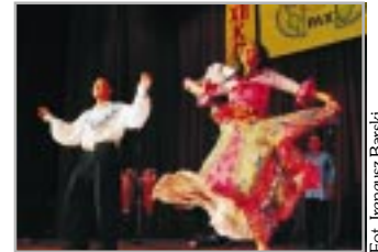
Fot. Ireneusz Barski