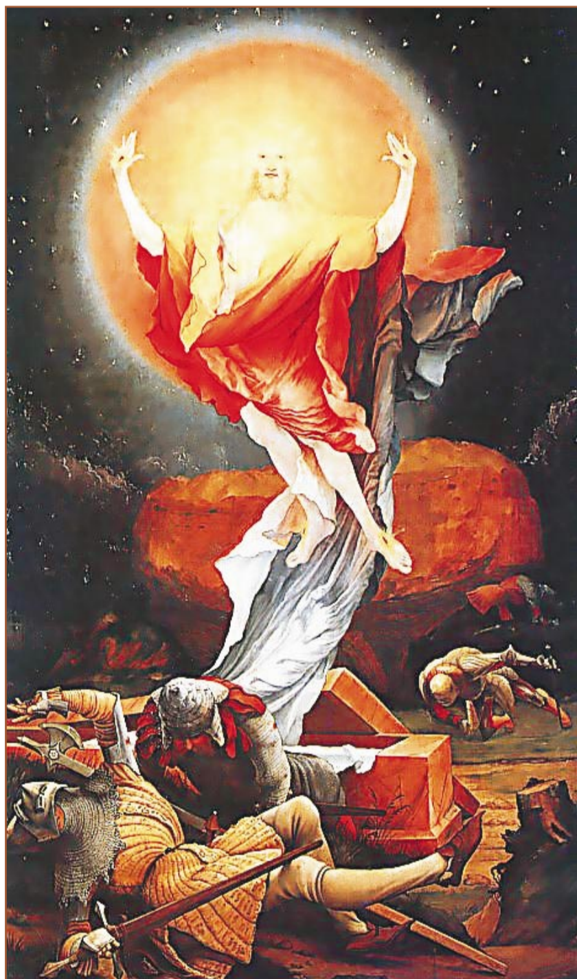
Matthias Grünewald – malarstwo niemieckie, XVI wiek

„Na granicy drogi nie ma drogi, jest meta. Na granicy wspinaczki nie ma wspinaczki, jest szczyt. Na granicy nocy nie ma nocy, jest świt. Na granicy zimy nie ma zimy, jest wiosna. Na granicy śmierci nie ma śmierci, jest ŻYCIE!”